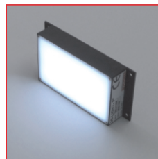
HI-LIGHT-P 2 weiß