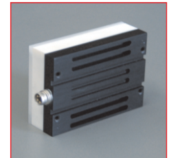
PICCO-MD Gehäuse mit integrierten Kühlrippen