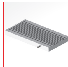
HI-LIGHT-120/240 Gehäuse mit integrierten Kühlrippen